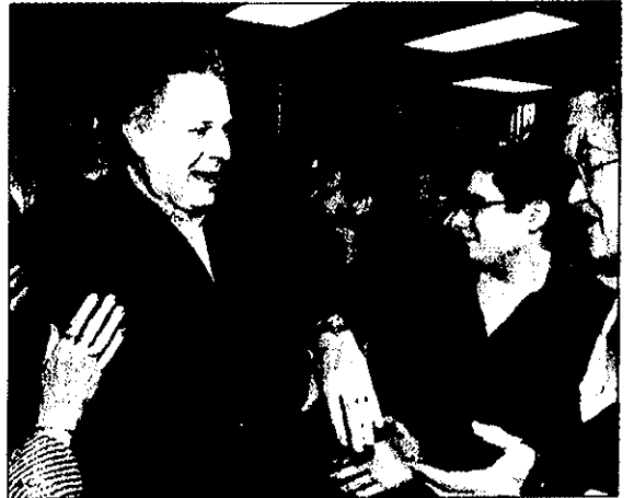
Jean Charest a pris plusieurs bains de foule pendant son passage au Saguenay—Luc-Saint-Jean.

M. Charest a mentionné que le projet des cinq parcs nécessitera des négociations avec les Inuits tout en ne cachant pas que le processus de création d'un tel réseau de parcs est long. □