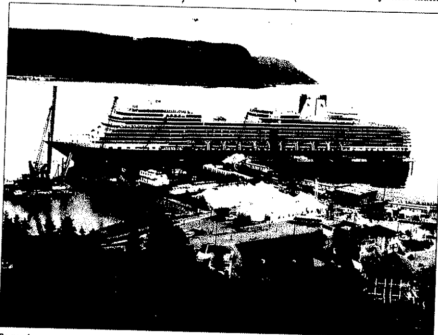
De nombreux passagers du MS Eurodam ont débarqué pour aller se promener ou prendre part à l'une ou l'autre des excursions proposées.

Ce dernier n'a pu s'empêcher de profiter de l'occasion pour remercier avec effusion le ministre Jean-Pierre Blac-